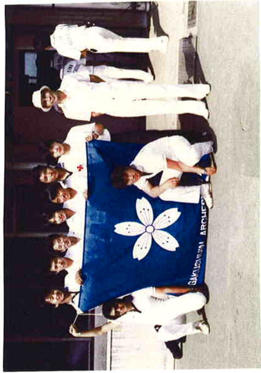
1983.6.5 第4回関東大会（埼玉県・上尾市）